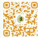
Álbum de fotos