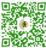
Web de las Jornadas.