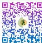
Lista de reproducción